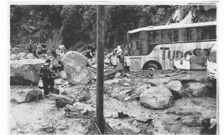
... Einer Zeitung vom 24.