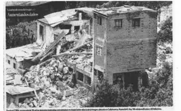
Según OCHA, un total de 20 familias resultaron afectadas por las inundaciones en la zona de Casapalca, Cajamarca, el 18 de noviembre de 2015.

Der frühere Leiter von "Misereor" war zu der Zeit gerade in Lima. Sein persönlicher Bericht ist eindrucksvoller als alle Zeitungsartikel.