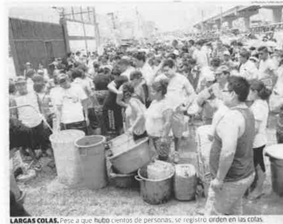
LARGAS COLAS. Pese a que hubo cientos de personas, se registró orden en las colas

Die ca. 9 Millionen-Stadt Lima war 5 Tage lang, Piura und Trujillo wochenlang ohne Trinkwasser (nur aus Sprudelflaschen) vor den Wassertankwagen bildeten sich lange Schlangen. Auch das Abwasser funktionierte nicht mehr (Klospülung!).