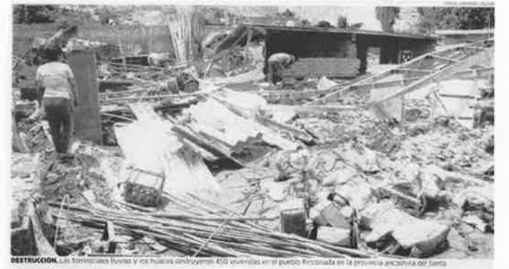
DESTRUCCION. Las tormentas lluvias y las huacas destruyeron 450 viviendas en el pueblo Pucallata en la provincia andina de Santa