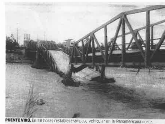
PUENTE VIRU. En 48 horas restablecerán pase vehicular en la Panamericana norte.